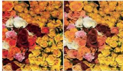
Abb. 1: Vergleich zwischen Darstellung bei hohem CRI (links) und niedrigem CRI (rechts).

mit 6.500 K. Eine Lichtquelle die dieses Spektrum bei der zugehörigen Farbtemperatur abstrahlt hat einen CRI von 100. Als Standard wird der generelle CRI (R a 8) mit acht Referenzfarben geringer und mittlerer Sättigung verwendet (siehe Abb. 1).