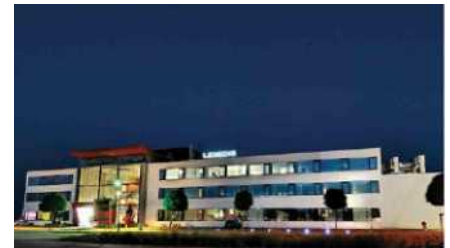
Abb. 4: Im Technologiepark Jennersdorf in Österreich treibt LEXEDIS die Forschung im Bereich LED voran und präsentiert nun die hocheffiziente digitale Lichtquelle powerXED mit einem CRI von 90.

Anwendungsgebiete in denen hohe CRI-Werte benötigt werden und die powerXED optimal zum Einsatz kommt, sind medizinische Anwendungen wie z.B. Operationsräume sowie Museen, Einkaufszentren, Shops und vielzählige Arten der direkten bzw. indirekten Werbebeleuchtung.